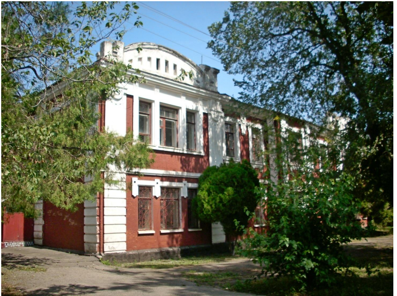
Колишня чергова машиністів (2014 р.)